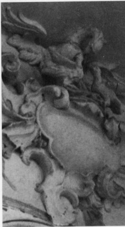
Der Pelikan, ein altes Symbol der Opferbereitschaft. Detail aus dem Treppenaufgang zur Pfarrwohnung.

Also vieles unter einem Dach! Das galt nun auch für Pfarramt und Pfarrwohnung in mancherlei Weise. Hier spielte sich das Leben der Pfarrfamilien ab. Hier fanden auch die verschiedensten Aktivitäten ihren Raum. Wobei es immer galt, beides, Familienleben und Gemeindearbeit, aufeinander