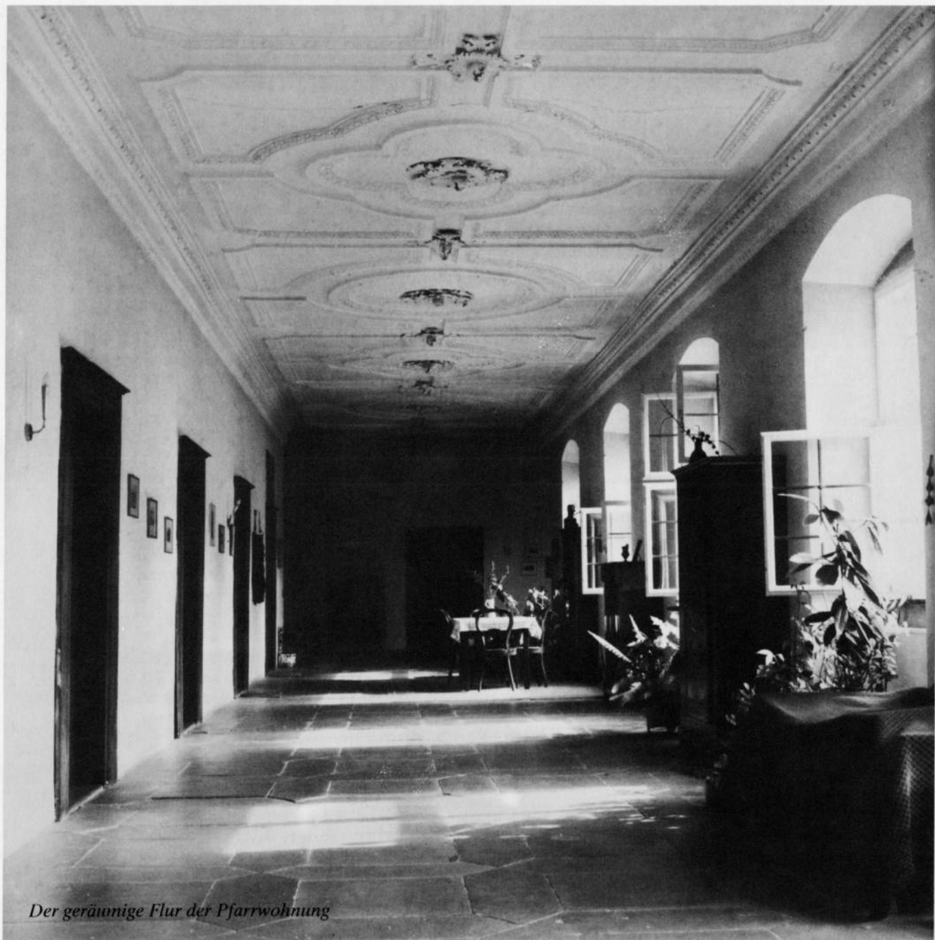
Der geräumige Flur der Pfarrwohnung